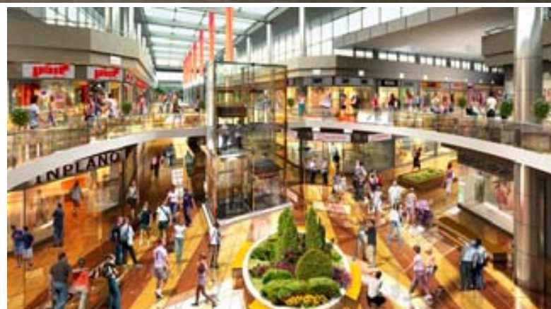
Galeria Jurajska jest jednym z większych tego typu obiektów w Polsce

Wycieczka do skansenu to jeden z elementów edukacji zawodowej. Warto przypomnieć, że młodzi technicy z ZSOT wizytowali również największą w Polsce inwestycję budowlaną - Galerię Jurajską. Zostali wówczas oprowadzeni po budowie. Podczas obserwacji prowadzonych z dużym rozmachem prac mieli możliwość porozmawiać na temat praktycznej strony zastosowania nowoczesnych rozwiązań konstrukcyjnych, technologicznych i materiałowych. Dzisiaj, kiedy Galeria została otwarta, mogą już skonfrontować swoje wyobrażenia z rzeczywistością. Galeria jest jednym z większych tego typu obiektów w Polsce. Koszt inwestycji oszacowano na poziomie