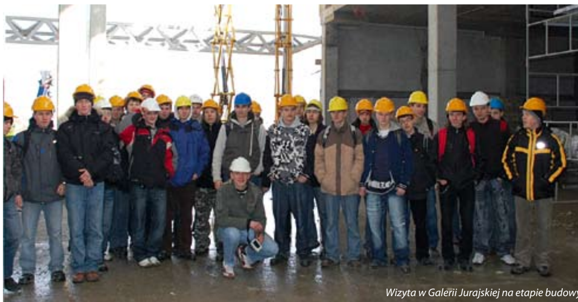
Wizyta w Galerii Jurajskiej na etapie budowy

Nauczyciele przedmiotów zawodowych - budowlanych w Technikum nr 2 przekazują uczniom wiedzę nie tylko w systemie lekcyjnym, ale również poprzez obserwację prac prowadzonych w terenie - między innymi na okolicznych budowach.