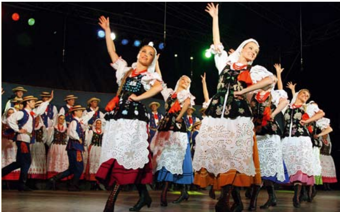
ZESPÓŁ PIEŚNI I TAŃCA „ŚLĄSK” IM. STANISŁAWA HADYNY LAUREATEM ZŁOTEGO MEDALU AKADEMII POLSKIEGO SUKCESU

Akademia Polskiego Sukcesu jest rozszerzeniem działań promocyjnych, prowadzonych przez Stowarzyszenie Polski Klub Biznesu od 15 lat.