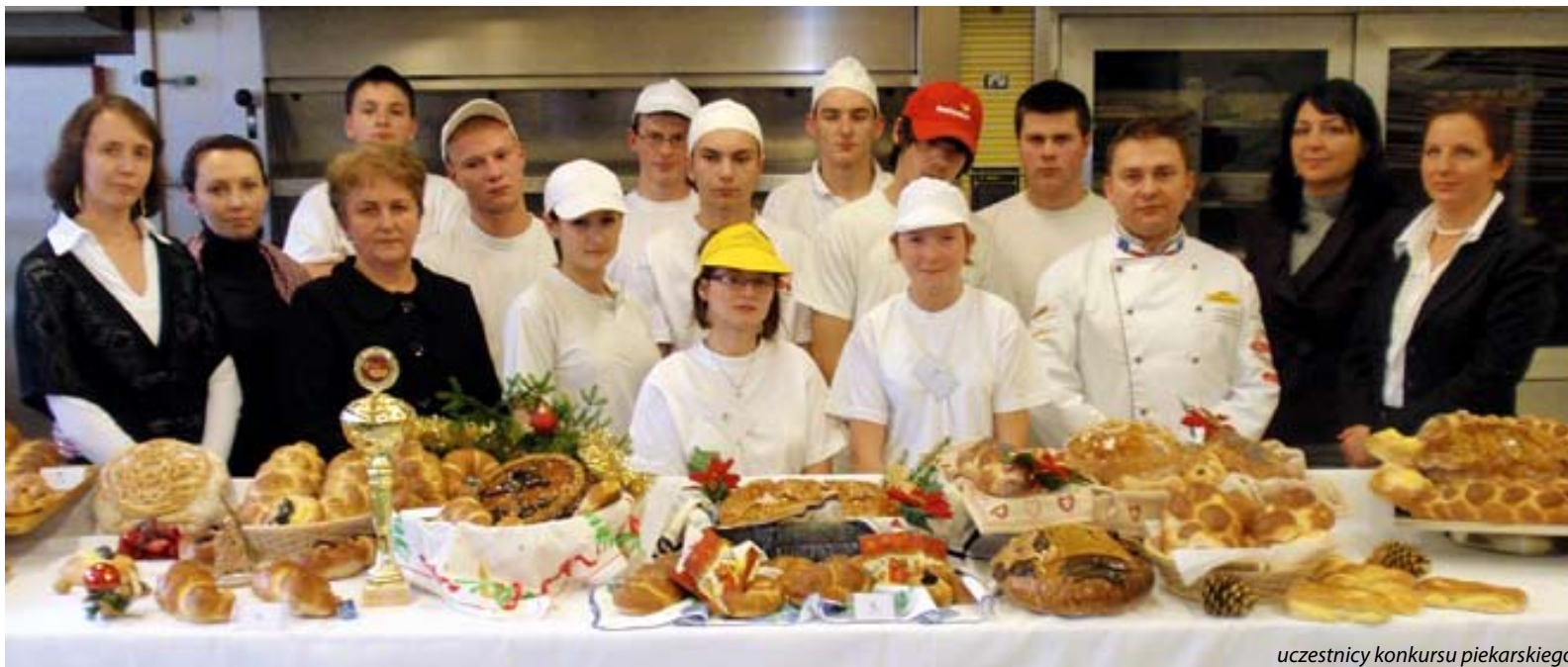
uczestnicy konkursu piekarskiego