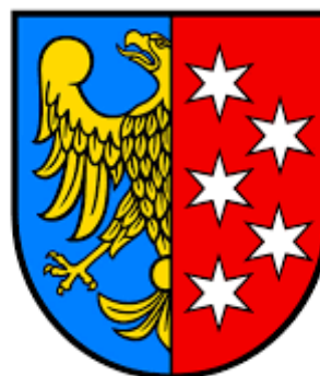
Urząd Miasta w Lublińcu