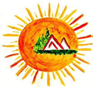
Dom Pomocy Społecznej „Zameczek”