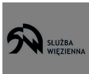
Zakład Karny w Lublińcu