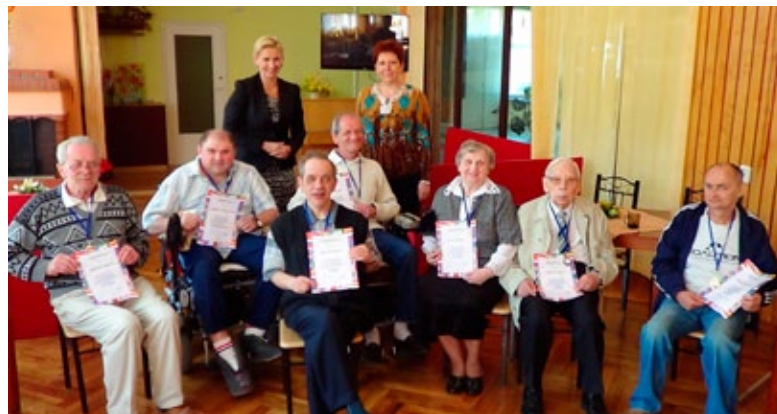
Z bezpłatnych lekcji języka angielskiego korzystają m.in. pensjonariusze DPS Dom Kombatanta

– Wiele udało się osiągnąć, jednak nie poprzestajemy na dokonaniach i każdego roku „dźwigamy poprzeczkę”. Stawiamy na nowoczesne metody nauczania i cyfryzację procesów poznawczych, każde zajęcia są rejestrowane cyfrowo i wraz z notatkami