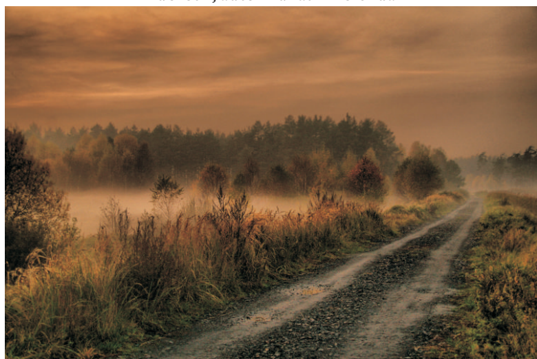
I nagroda w kategorii Ziemia Lubliniecka - zielony zakątek Śląska - dorośli; autor Filip Hepner