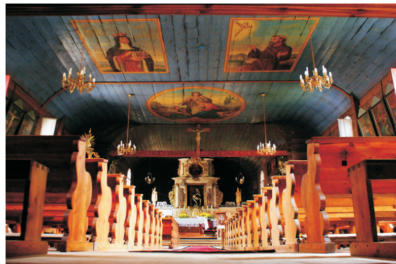
I nagroda w kategorii Piękno architektury zabytkowej - młodzież do 21 lat; autor Mariusz Kasprzak