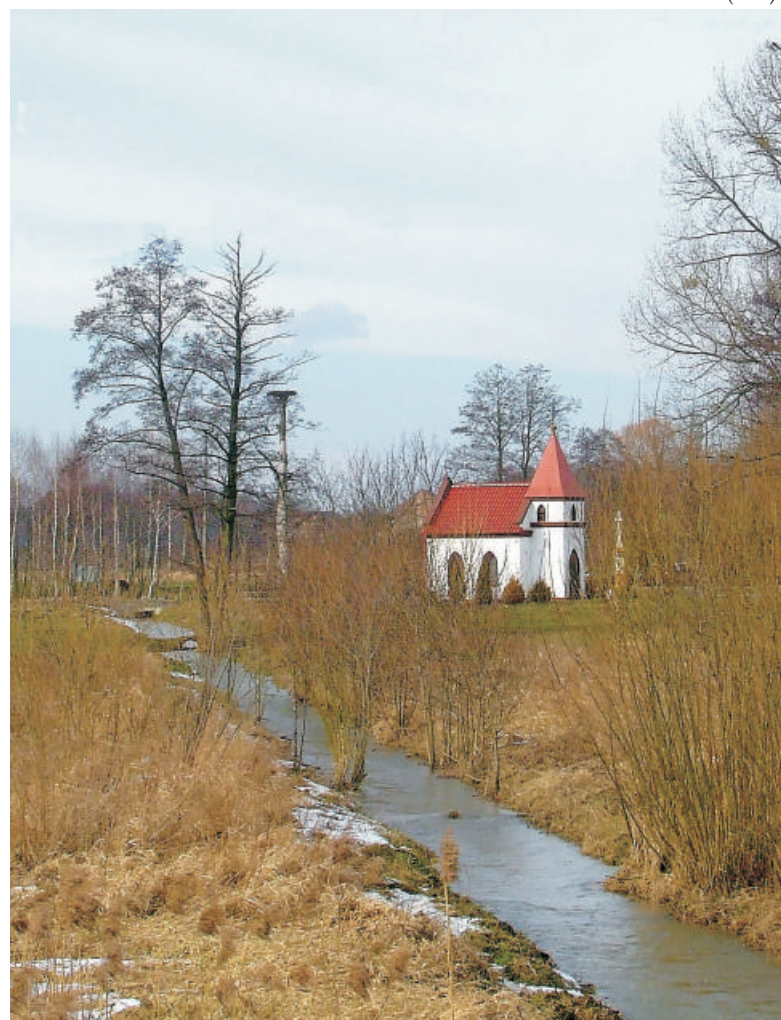
Zdjęcie Roku 2010