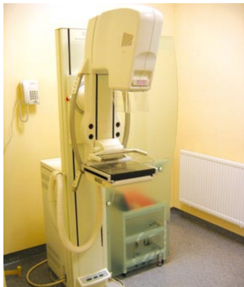
Kamera identyfikacyjna do mammografu ID