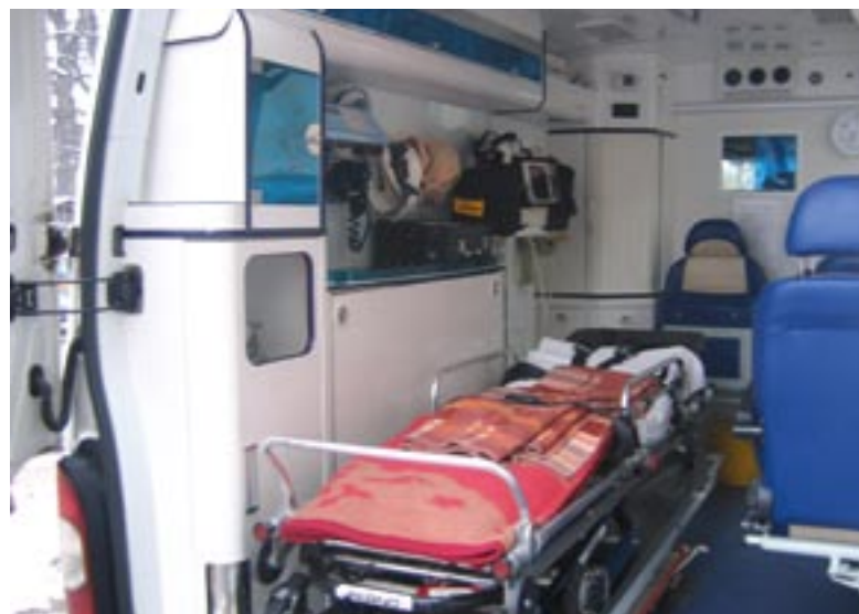
Karetka pogotowia ze specjalistycznym sprzętem przystosowanym do zdiagnozowania i ratowania życia pacjentów w przypadku jego zagrożenia