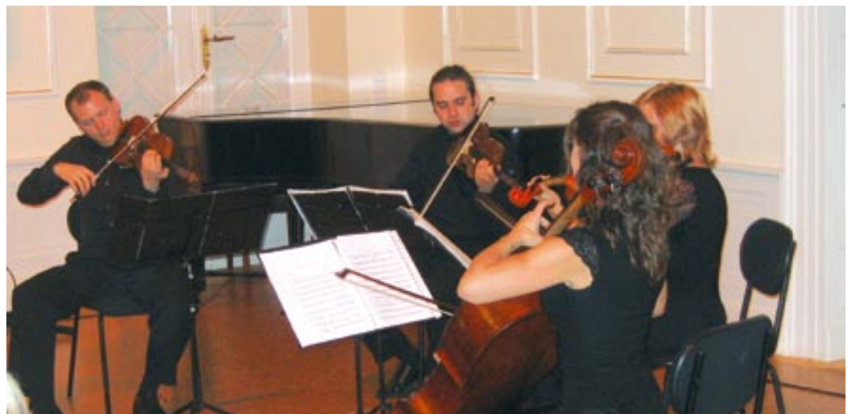
Kwartet smyczkowy ALTRA VOLTA