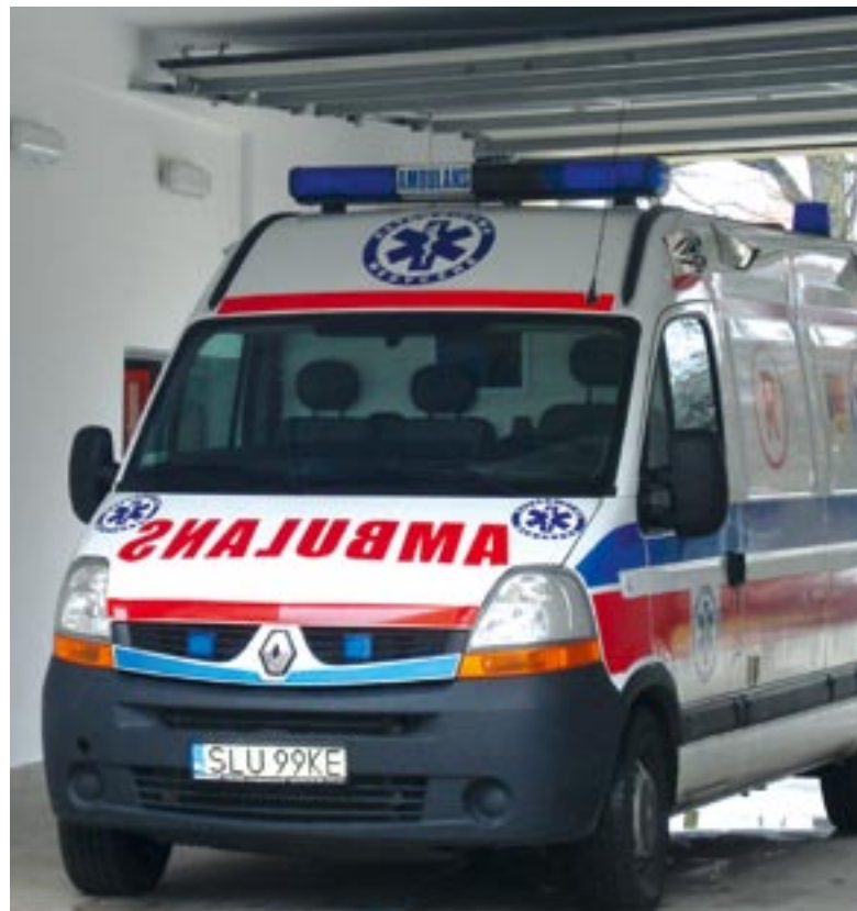
Karetka zawsze gotowa do wyjazdu