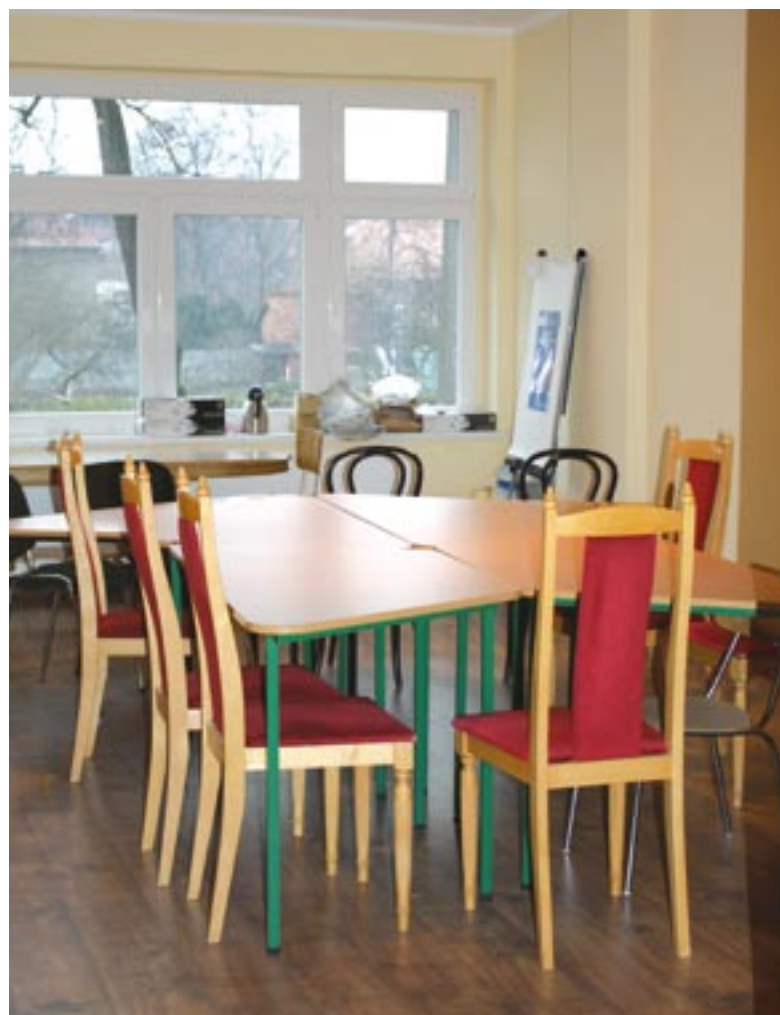
Sala w PCPR – wyposażona ze środków EFS.