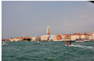
Kamila Paruzel - „Wenecja – widok z tramwaju wodnego”