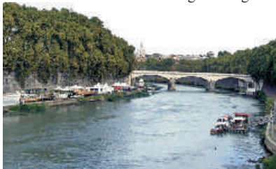
Monika Kielbas - „Widok na most”