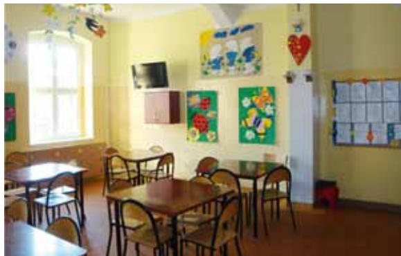
Świetlica w szkole przyszpitalnej