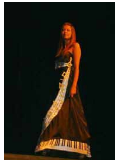
Konkurs Suknia w stylu klasycznym inspirowana muzyką Chopina