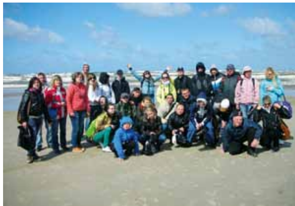
Dania – 2012 r.