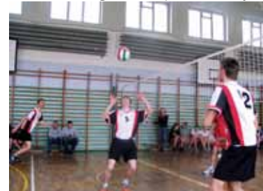
Wojewódzkie Mistrzostwa Szkół Specjalnych w Piłce Siatkowej Częstochowa