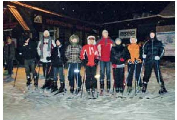
Pieniny – wyjazd na narty