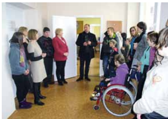
Otwarcie Wielospecjalistycznego Gabinetu Terapeutycznego-własność SOSW