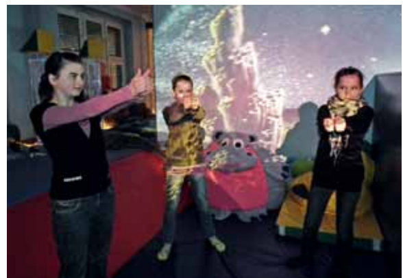
Terapia psychologiczna w SDS