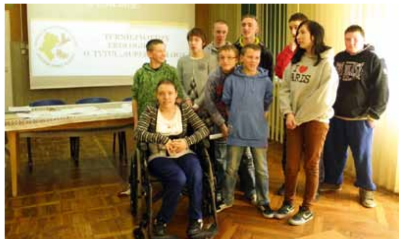
Konkurs wiedzy ekologicznej

W naszym Ośrodku często gościmy pasjonatów przyrody, którzy prezentują uczniom interesujące prelekcje wzbogacone o cenne eksponaty. Nasi uczniowie chętnie biorą udział w akcjach i konkursach ekologicznych takich jak: „Sprzątanie Świata” „Ratujmy kasztanowce”, „Święto Drzewa”, „Pomagamy i dokarmiamy”. Odbywa się zbiórka surowców wtórnych: kartridży, baterii, puszek aluminiowych, telefonów, nakrętek plastikowych.