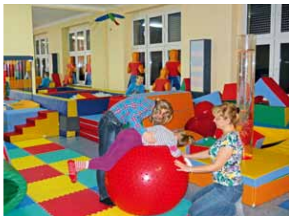
Snoezelen, czyli terapia na Sali Doświadczenia Świata

Zaowocowało to podpisaniem umowy partnerskiej z Laboratorium. Umowa gwarantuje nam nieodpłatne korzystanie ze sprzętu Laboratorium, wykonywanie badań QEEG, korzystanie z porad specjalistów