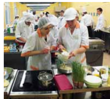
Młodzi gotują 2013