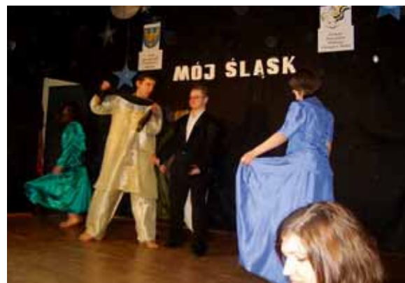
Cicho-Sza na Chorągwanym Festiwalu Piosenki i Tańca