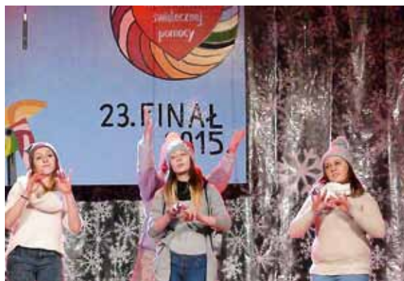
Cicho-Sza w trakcie 23. finału Wielkiej Orkiestry Świątecznej Pomocy na koncercie w MDK Lublińcie