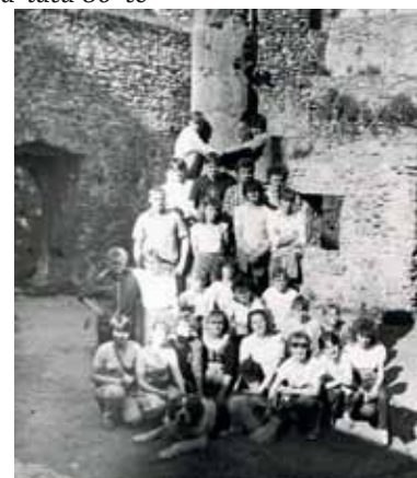
Zamek Piastowski w Bolkowiu - 1989 r.