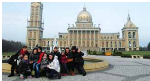
Licheń – rok szkolny 2013/2014