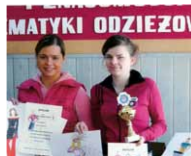
Konkurs Projektowania Odzieży i Znajomości Tematyki Odzieżowej