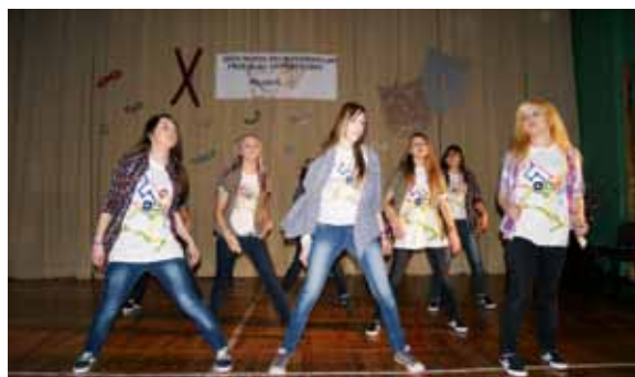
X Ogólnopolski Przegląd Artystyczny Poznań 2011