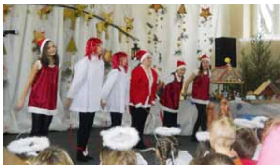
Wspólne Kolędowanie Lubliniec 2013