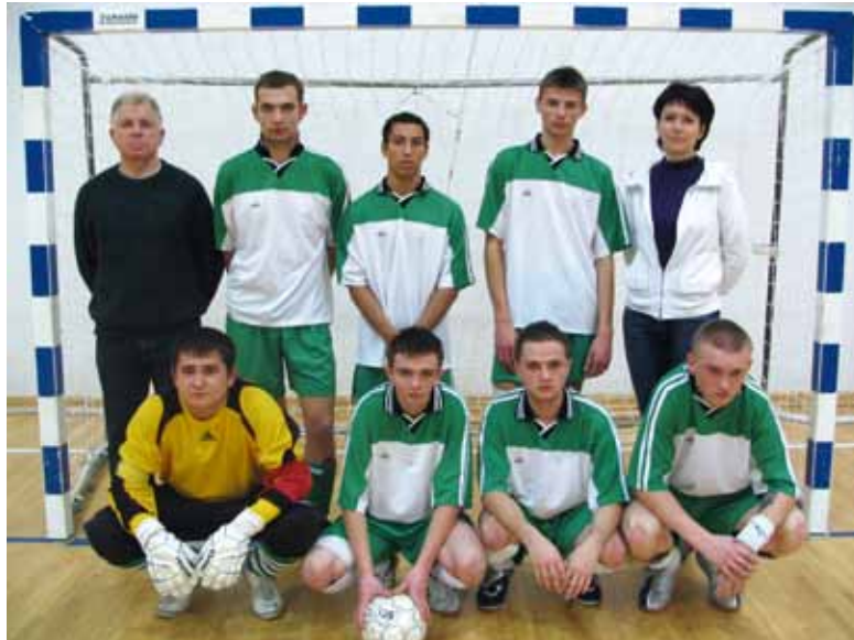
Młodzieżowe Mistrzostwa Polski w Piłce Nożnej Lublin