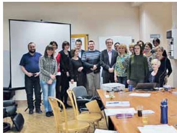
Szkolenie QEEG-Laboratorium Badań Eksperymentalnych AJD