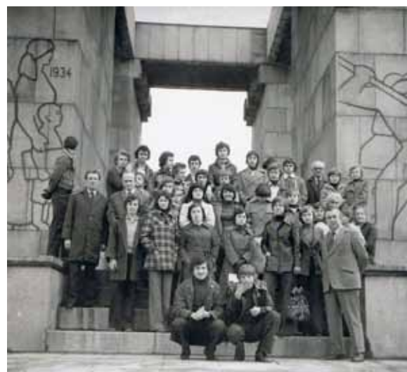
Wycieczka szkolna - lata 80-te

W latach 1995-2001 nawiązaliśmy współpracę z Ośrodkiem w Raciborzu, w wyniku czego zorganizowano wycieczki po Europie Zachodniej m.in. do Chorwacji, Włoch, Hiszpanii. Uczniowie mieli okazję dodatkowo zwiedzić: Monte Carlo, Lazurowe Wybrzeże, Monako, Wenecję i Wiedeń.