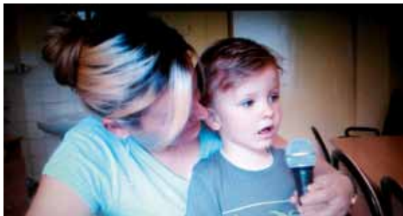
Specjalistyczna terapia logopedyczna

Przez wszystkie lata istnienia Specjalnego Ośrodka Szkolno-Wychowawczego, zatrudnieni tu specjaliści dbają o wszechstronny rozwój wychowanków. Poza zajęciami dydaktycznymi są tu więc też, zajęcia terapeutyczne.