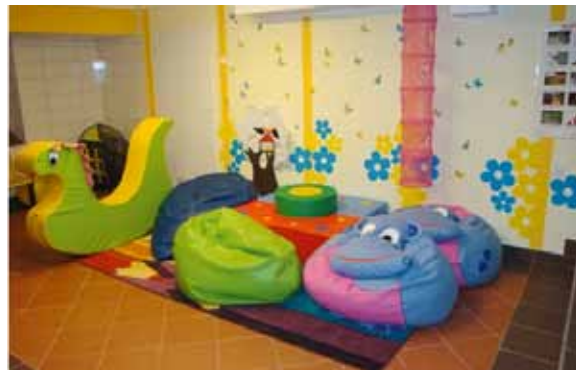
Miejsce zabaw – Radosna Szkoła dla szkół filialnych