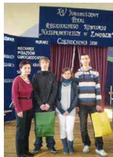
Konkurs Najsprawniejszy w zawodzie krawiec Częstochowa