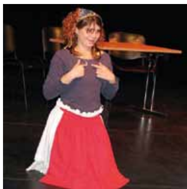
VIII Przegląd Teatrów Dzieci i Młodzieży z Wadą Słuchu w Szczecinie