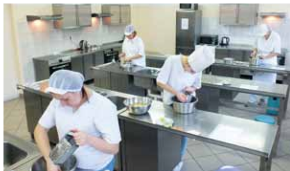
Zajęcia w pracowni technologii gastronomicznej