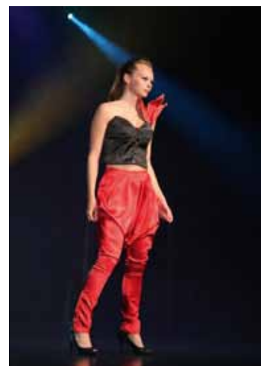
Prezentacja stroju Awangarda bez granic na deskach MDK Częstochowa