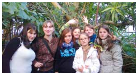
Palmiarnia w Poznaniu – rok szkolny 2012/2013