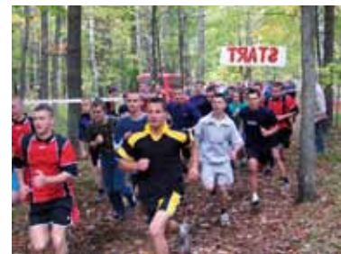
Jesienne Biegi Przelajowe Herby