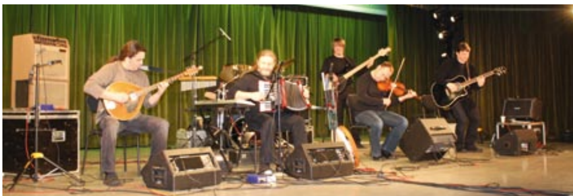
Występ zespołu Carrantuohill