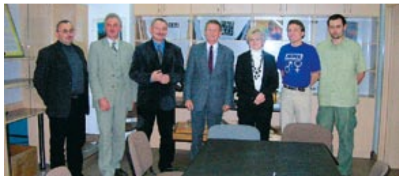
13 listopada 2007 r. Warszawa – Instytut Paleobiologii PAN