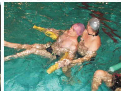
Zajęcia na basenie