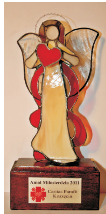
Kapituła Parafialna przyznała honorową nagrodę „Anioł Miłosierdzia 2011” Bankowi Spółdzielczemu w Koszęcinie

Zarząd Caritas Parafii NSPJ w Koszęcinie