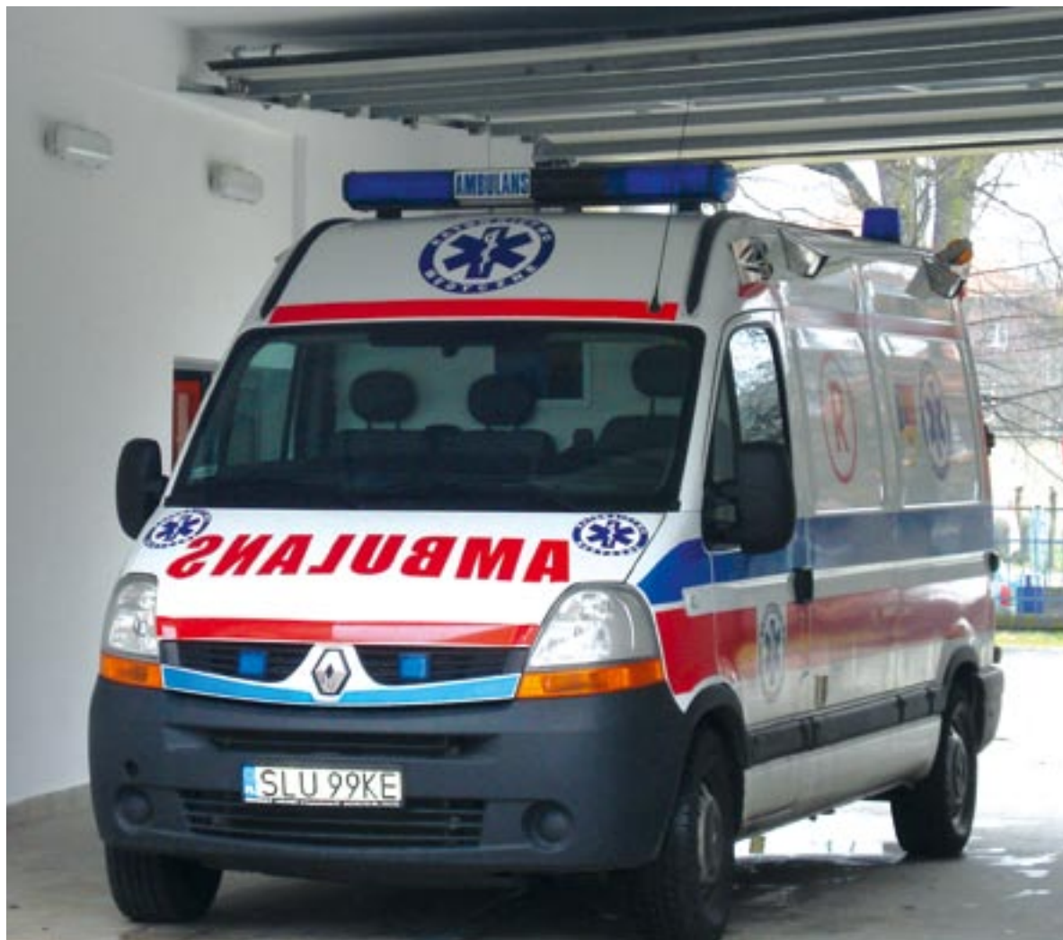
Karetką zawsze gotowa do wyjazdu