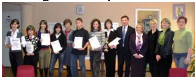
Finał Powiatowego Konkursu Ortograficznego

W Gimnazjum nr 1 w Lublińcu odbył się V Powiatowy Konkurs Ortograficzny pod patronatem Starosty Lublinieckiego dla młodzieży gimnazjalnej.