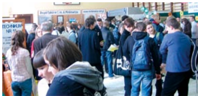
Powiatowe Targi Edukacyjne cieszyły się dużym zainteresowaniem gimnazjalistów