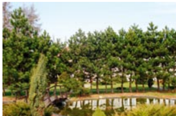
Miejsce spacerów i wypoczynku mieszkańców

W domu są pokoje 2, 3 i 4 osobowe, z których większość posiada własny węzeł sanitarny. Mieszkańcy mają możliwość korzystania z sali gimnastycznej i zabiegów m.in. laseroterapii czy ciepłolecznictwa. Korzystają również z różnych form spędzania wolnego czasu – wyjeżdżają na wycieczki krajoznawcze, biorą udział w imprezach kulturalno – oświatowych organizowanych na terenie domu i w innych placówkach. Dom organizuje corocznie Piknik Integracyjny z oka-