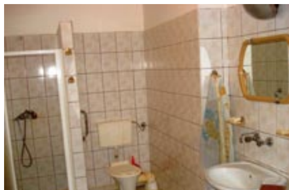
Jedna z wielu odnowionych łazienek