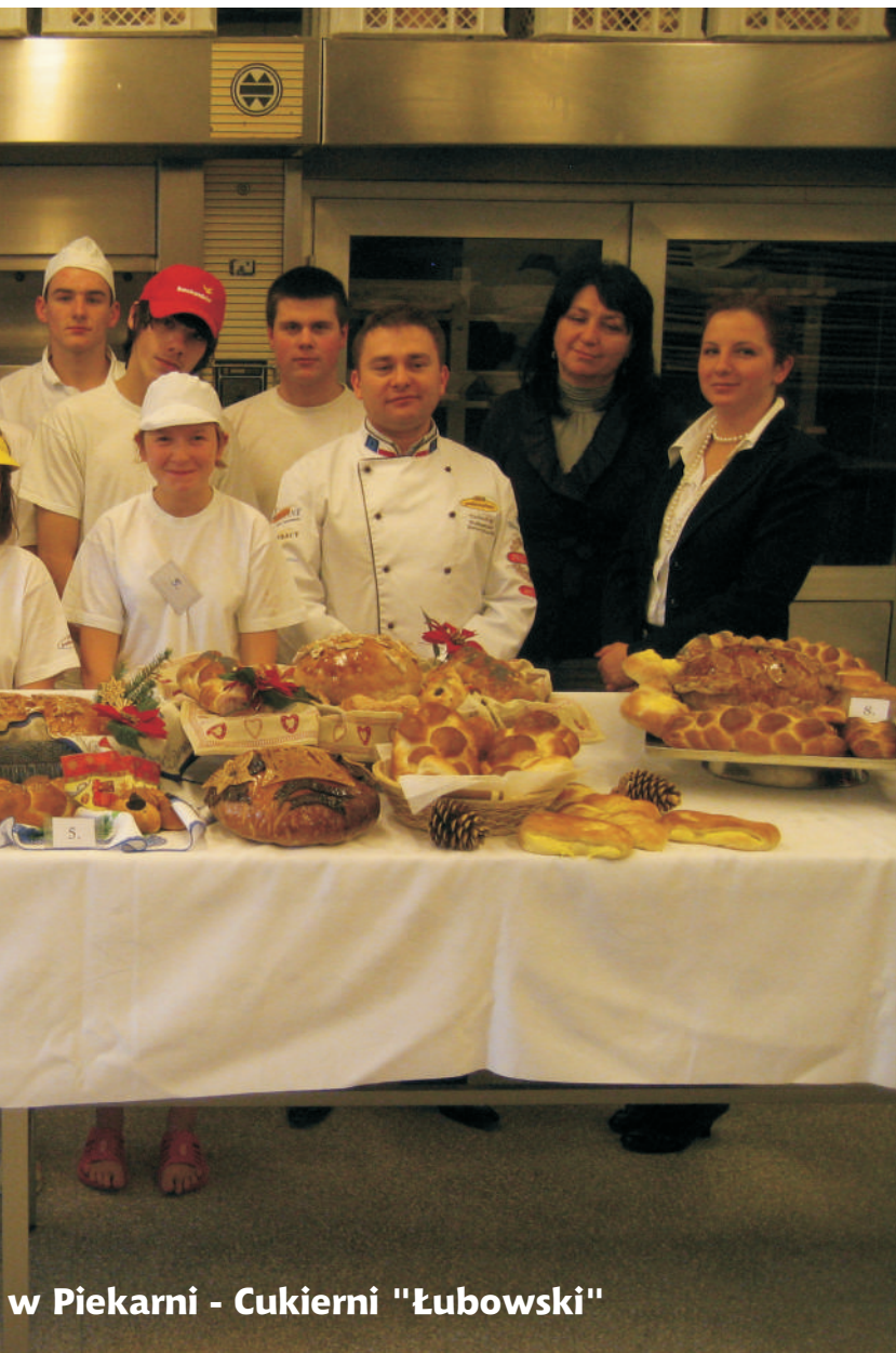
w Piekarni - Cukierni "Łubowski"