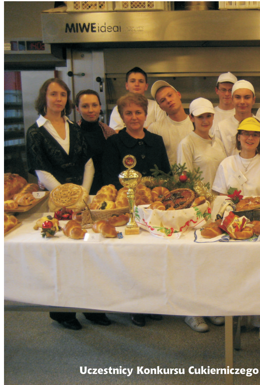
Uczestnicy Konkursu Cukierniczego

AK: Wiem, że podbiliście Państwo nie tylko nasz - powiatowy rynek, ale sprzedajecie również swoje produkty w Strzelcach Opolskich, Bytomiu czy Zabrze. Jak to się