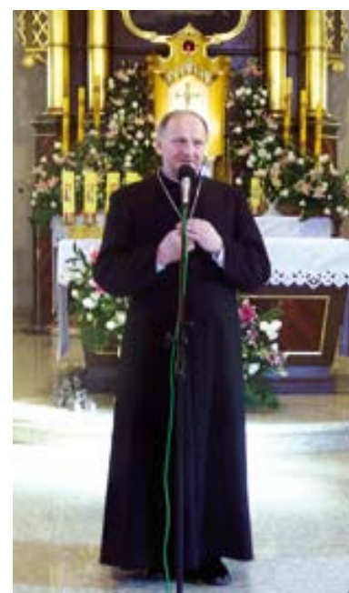
biskup opolski Paweł Stobrawa