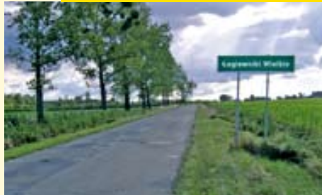
Na drodze przebiegającej przez gminę Pawonków i gminę Ciasna planowana jest modernizacja nawierzchni.

STAROSTWO POWIATOWE W LUBLINCU ZŁOŻYŁO W URZĘDZIE WOJEWÓDZKIM DWA WNIOSKI O DOFINANSOWANIE INWESTYCJI NA DROGACH POWIATOWYCH W RAMACH „NARODOWEGO PROGRAMU PRZEBUDOWY DRÓG LOKALNYCH 2008 - 2011”.