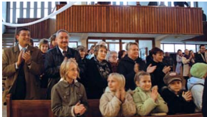
koncert w Łagiewnikach Wielkich publiczność nagrodziła gromkimi brawami