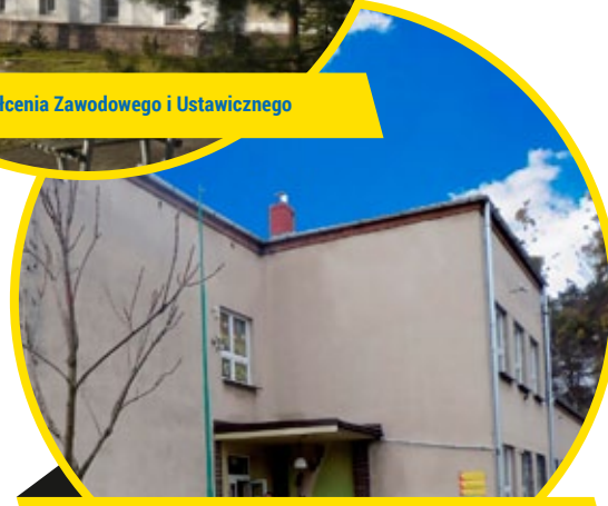
Specjalny Ośrodek Szkolno-Wychowawczy im. Konrada Mańki