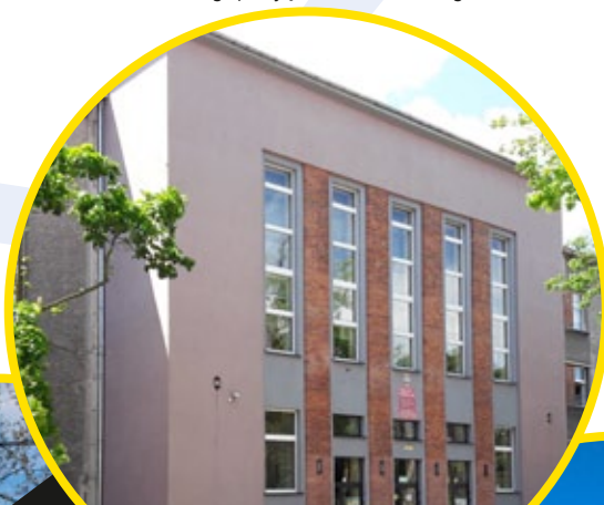
Zespół Szkół nr 1 im. Adama Mickiewicza