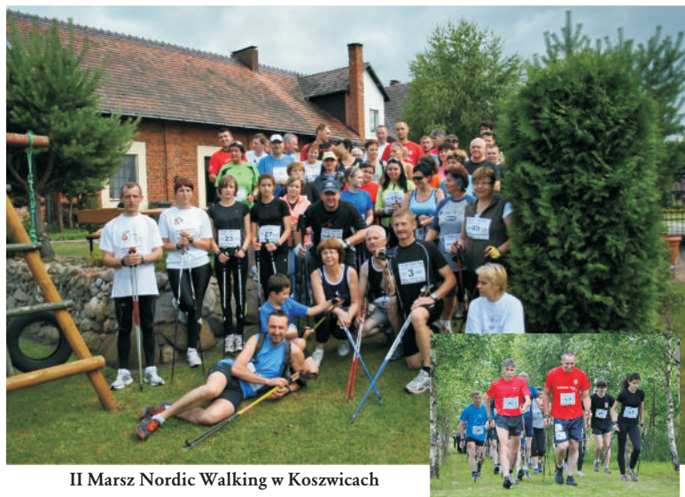
II Marsz Nordic Walking w Koszvicach