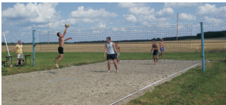
Turniej Piłki Plażowej pod patronatem Starosty Lublinieckiego

Turniej piłki plażowej oraz skata sportowego, pokazy strażackie, taniec towarzyski, występy Piekarskiego Trio z Radia Piekary oraz dzieci i młodzieży z Sadowa to tylko niektóre z atrakcji, jakie dla mieszkańców miejscowości i okolic zorganizowało sołectwo Sadów wraz z miejscową Ochotniczą Strażą Pożarną. W słoneczny weekend 13 i 14 sierpnia na letnim festynie Dni Sadowa bawiło się każdorazowo około 1500 osób. Dla dzieci ustawiono karuzele, można było się także przejechać konno lub bryczką. Do późnej nocy rozbrzmiewała także muzyka taneczna, przy której bawili się zarówno dorośli jak i młodzież.