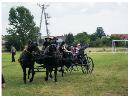
Jedną z atrakcji festynu był przejazd bryczką