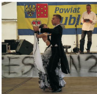
Pokaz tańca towarzyskiego