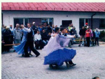
pokazy tańca towarzyskiego w wykonaniu grupy tanecznej działającej przy MDK w Lublińcu