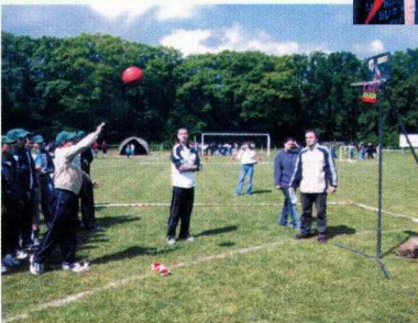
rzut piłką do kosza