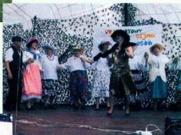
uczestnikom Sejmiku dopisywały humory