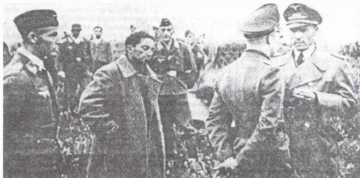
zdjęcie syna Stalina w otoczeniu Niemców, najczęściej eksponowane w prasie całego świata