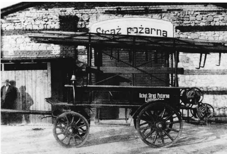
W 1930 roku Magistrat zakupił dla straży nowy konny wóz strażacki