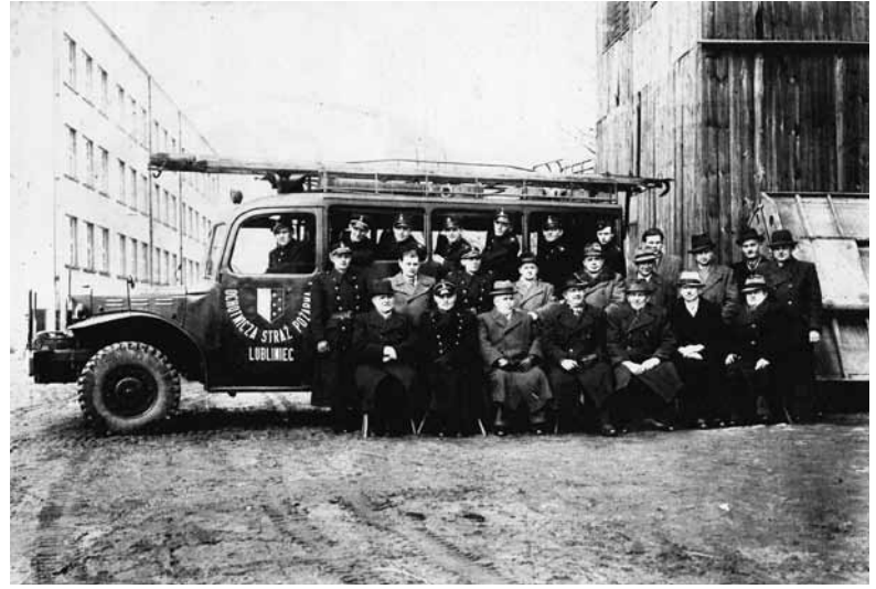
Samochód Dodge po zabudowie w roku 1947