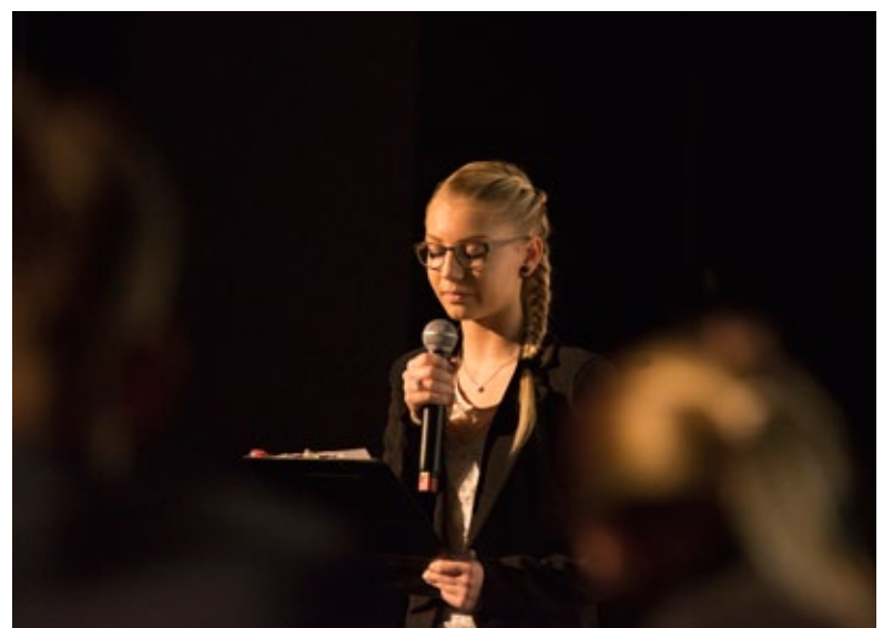
Debate. Młodzież z lublinieckich szkół ponadgimnazjalnych poruszyła temat zgody świadomej i zgody domniemanej.

silną i słabą. Różni je przyznanie bądź nie rodzinie zmarłego prawa do zgłoszenia sprzeciwu. W formie słabej rodzina może zgłosić sprzeciw, nie dopuszczając do pobrania narządów, jeśli