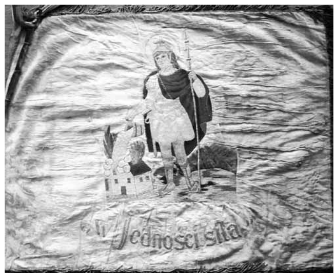
Sztandar OSP Lubliniec w dniu uroczystości 50-lecia