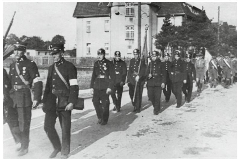
Zdjęcia z uroczystości 50-lecia OSP Lubliniec w dniu 3 lipca 1932 roku