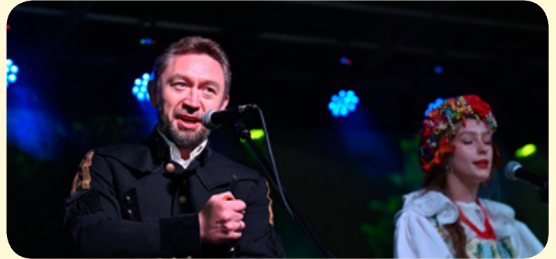
Koncert w Parku Miejskim