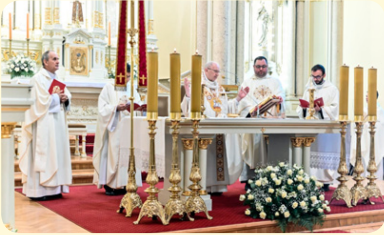
Msza św. w kościele pw. św. Stanisława Kostki w Lublińcu