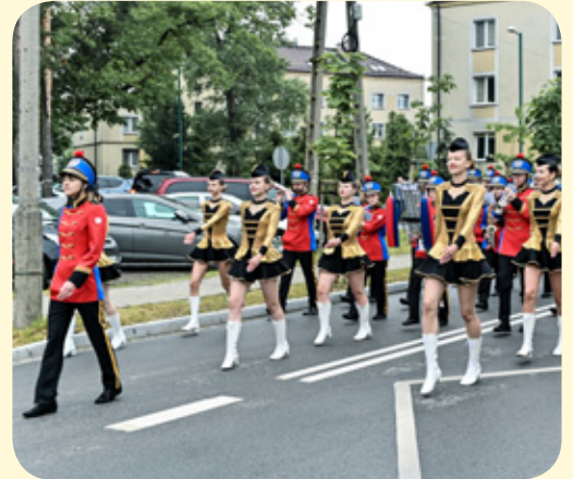
Powitanie przy wejściu głównym do Szkoły przez Orkiestrę Dętą Lublinieć i Zespół Mażorettek