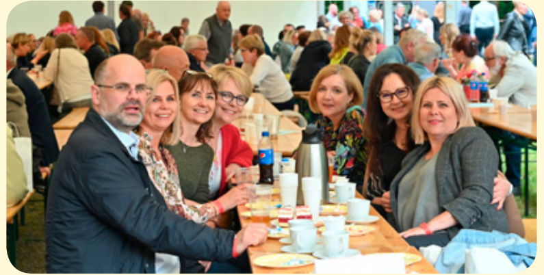
Zjazd absolwentów w Parku Miejskim