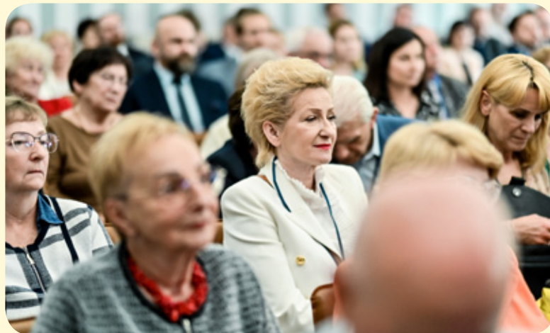
Uroczysta akademia w auli szkolnej