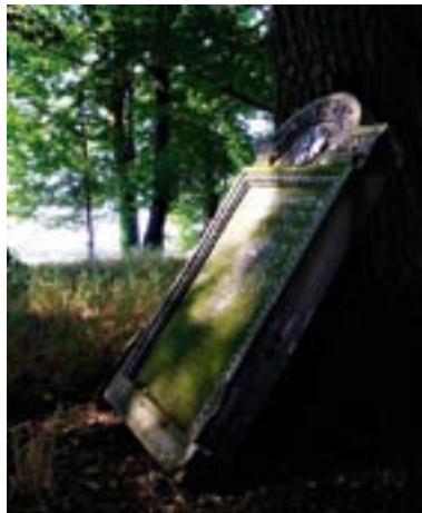
Julita Rygalska – ZABYTKI POWIATU...