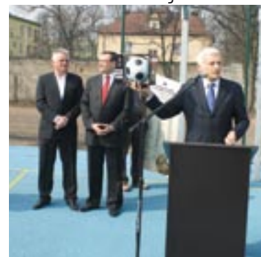
Przemówienie Jerzego Buzka

Boisko przy Zespole Szkół nr 1 im. Adama Mickiewicza w Lublińcu powstało w ramach projektu „Moje Boisko – Orlik 2012”. Jego budowa sfinansowana została przez powiat lubliniecki (720 tys. zł), Urząd Marszałkowski (333 tys. zł) i Ministerstwo Sportu i Turystyki (333 tys. zł).