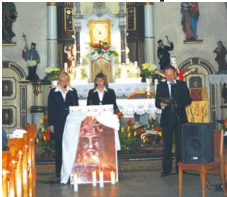
Występ artystów pieśni sakralnej

W niedzielne popołudnie, 19 kwietnia br. w kościele pw. Wniebowzięcia Najświętszej Maryi Panny w Lubecku odbył się już trzeci koncert w ramach Dni Kultury Chrześcijańskiej.