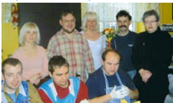
Uczestnicy WTZ z opiekunami