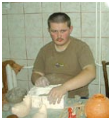
Zajęcia w pracowni garncarstwa

W Lublińcu Warsztaty Terapii Zajęciowej zostały utworzone w 1994 roku przy Domu Pomocy Społecznej przy ul. Kochcickiej i realizują zadania z zakresu rehabilitacji społecznej i zawodowej zmierzającej do ogólnego rozwoju każdego uczestnika.