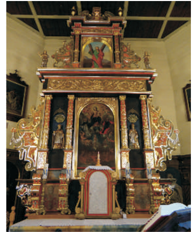
Ołtarz przed konserwacją i po konserwacji

Parafia rzymsko-katolicka NMP Królowej Różańca Świętego w Boronowie przeprowadziła remont ołtarza głównego. Prace prowadzone były po otrzymaniu zgody Wojewódzkiego Konserwatora Zabytków w Katowicach ze środków Urzędu Marszałkowskiego w Katowicach, Wojewódzkiego Urzędu Ochrony Zabytków w Katowicach, Starostwa Powiatowego w Lublińcu, Urzędu Gminy w Boronowie oraz własnych.