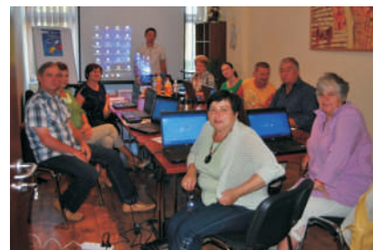
Uczestnicy podczas kursu komputerowego

Konsultant ds. koordynacji projektów europejskich