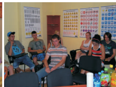
Uczestnicy podczas zajęć teoretycznych z prawa jazdy kat. B