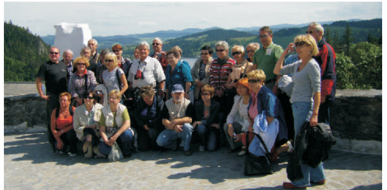
Uniwersytet Trzeciego Wieku jest organizatorem licznych wycieczek naukowo-turystycznych