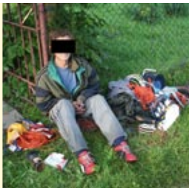
Włamywacz na działkach

W niedzielę rano, na terenie ogródków działkowych „Kolejarz” jeden z działkowców zauważył nieznanego mu mężczyznę i poinformował o tym fakcie dyżurnego Komendy Powiatowej Policji w Lublińcu. Policjantom, którzy przyjechali na miejsce mężczyzna nie potrafił odpowiedzieć co robi o tak wczesnej porze na terenie działek. Podejrzewając, że może być