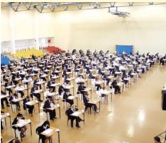
Matura w Zespole Szkół nr 1 im. A. Mickiewicza w Lublińcu

MATURZYŚCI POWIATU LUBLINIECKIEGO ZNALEŻLI SIĘ W TYM ROKU W PIERWSZEJ PIĄTKIE WOJEWÓDZTWA. EGZAMIN DOJRZAŁOŚCI ZDAŁO U NAS PRAWIE 85% ABSOLWENTÓW!