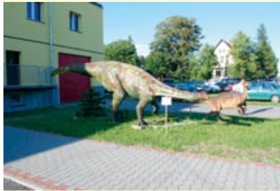
Model plateozaura przed budynkiem Muzeum Paleontologicznego w Lisowicach