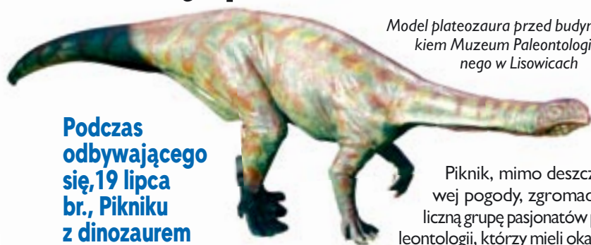
Model plateozaura przed budynkiem Muzeum Paleontologicznego w Lisowicach

Podczas odbywającego się, 19 lipca br., Pikniku z dinozaurem zorganizowanego przez Muzeum Paleontologiczne w Lisowicach, przekazany został model plateozaura, którego koszty zakupu w całości pokrył Powiat Lubliniecki.