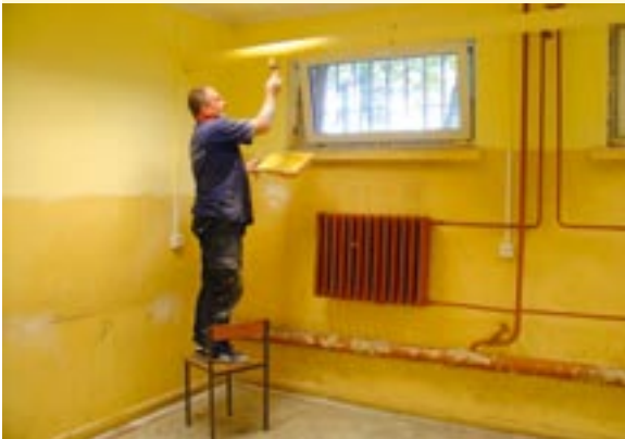
Prace remontowe w Zespole Szkół Ogólnokształcąco-Technicznych

WAKACJE TO JEDYNY OKRES, KIEDY MOŻNA W SZKOŁACH PRZEPROWADZAĆ REMONTY. BYŁY ONE PROWADZONE WE WSZYSTKICH JEDNOSTKACH, KTÓRYCH ORGANEM PROWADZĄCYM JEST POWIAT.