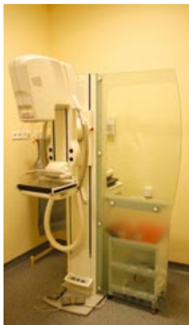
Mammograf w SP ZOZ w Lublińcu