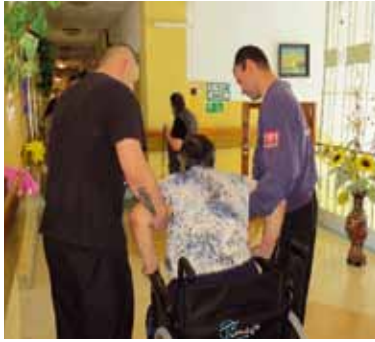
Osadzeni w Zakładzie Karnym w Herbach realizują wolontariat w DPS w Blachowni