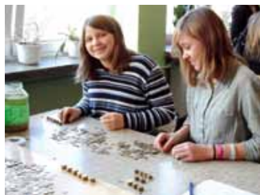
Działania wolontarystyczne w szkołach

Działania wolontarystyczne prowadzone są w szkołach średnich i gimnazjalnych, pomagają również uczniowie szkół podstawowych. Organizują akcje zbioru zabawek, książek, przyborów szkolnych, które przekazywane są najbardziej potrzebującym. Dzieci biorą udział w akcjach charytatywnych, np. „Góra Grosza”, w Wielkiej Orkiestrze Świątecznej Pomocy, aktywnie realizują projekt „Poczytaj mi Przyjacielu”.