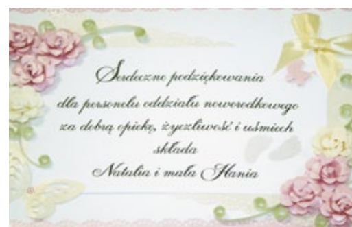
Praca i zaangażowanie pracujących na oddziale lekarzy i pielęgniarek doceniana jest przez rodziców przychodzących tu na świat dzieci