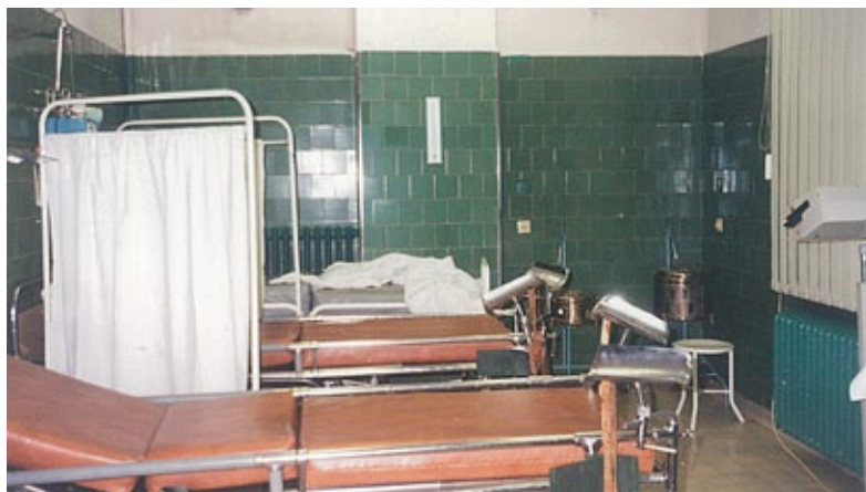
Zmodernizowana sala porodowa