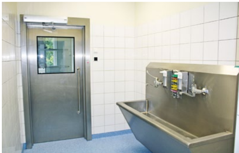
Myjnia chirurgiczna dla lekarzy przed salą operacyjną. Wyposażona jest w nierdzewne urządzenie zlewowe wraz z dezynfektorami. Drzwi do sali operacyjnej wykonane są z blachy nierdzewnej, kwasoodpornej i otwierane są w systemie bezdotykowym na fotokomórkę