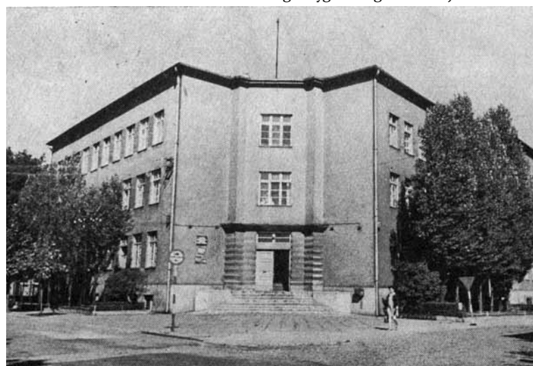
Lata 70-te szpital powiatowy w Lublińcu, w którym mieścił się oddział wewnętrzny i pediatryczny