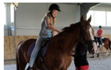
Zajęcia w stadninie koni fryzjskich w Kochcicach