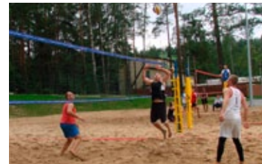
Turniej siatkówki plażowej w GOSiR w Koszęcinie