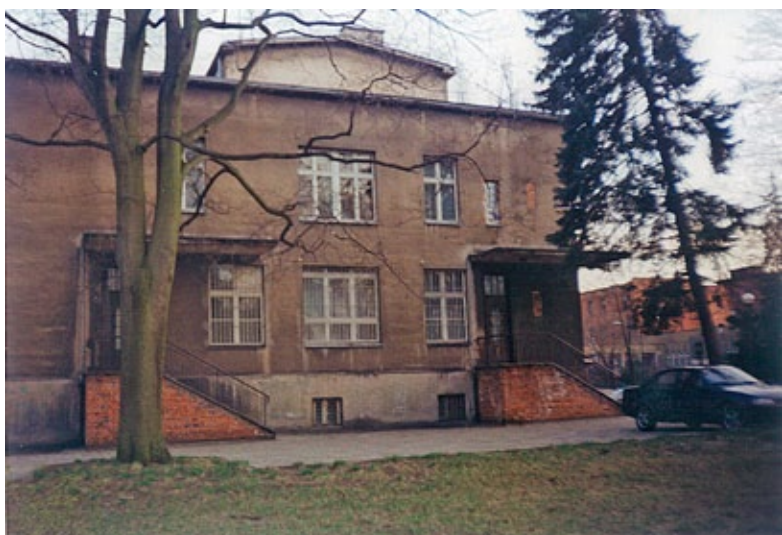
W latach 1971–2011 oddział noworodkowy mieścił się w „starym szpitalu”