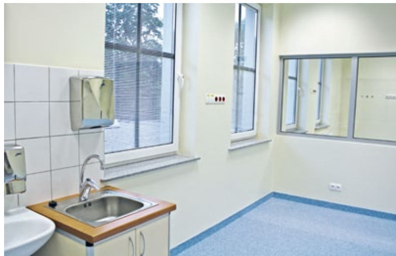
Oddział noworodkowy – segment neonatologiczny składający się ze szluzi fartuchowej bakteriobójczej, pomieszczenia obserwacyjnego oraz 2 sal noworodkowych z 8 miejscami na inkubatory