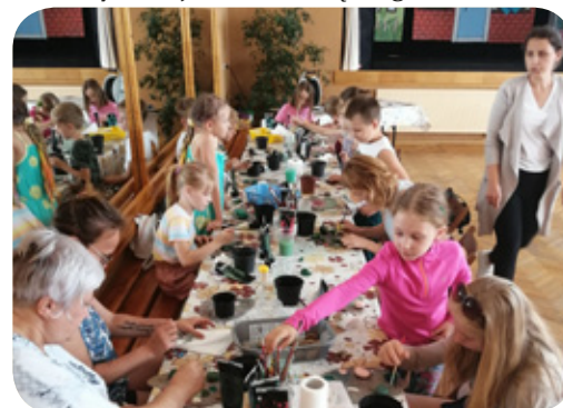
Zajęcia zorganizowane przez GCKiI w Kochanowicach