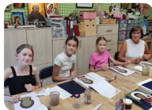
Miejsko - Gminny Ośrodek Kultury w Woźnikach zorganizował warsztaty tworzenia ikon