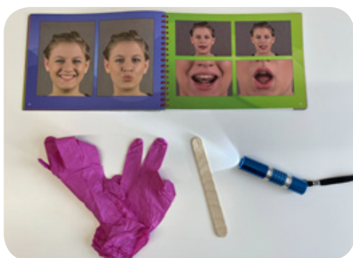
Diagnoza logopedyczna - Ninio Logo