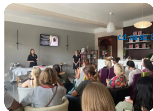
Kosmetologia, trychologia i zdrowy tryb życia były tematami spotkań zorganizowanych przez YASUMI w Lublińcu