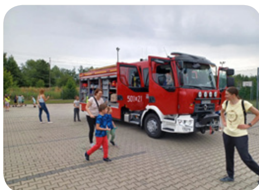
Pokazy sprzętu zorganizowane przez Komendę Powiatową PSP w Lublińcu