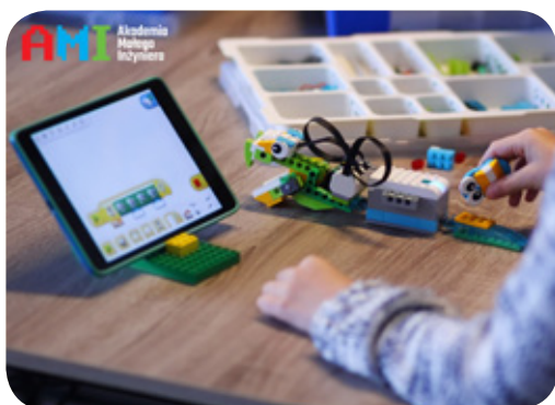
Zajęcia z robotyki LEGO zorganizowane przez AMI