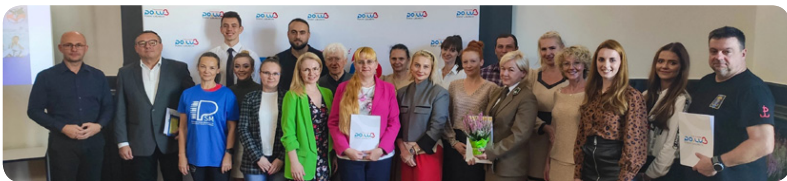
W Starostwie Powiatowym w Lublińcu odbyło się spotkanie podsumowujące projekt NASZ POWIAT NASZE PASJE 2023