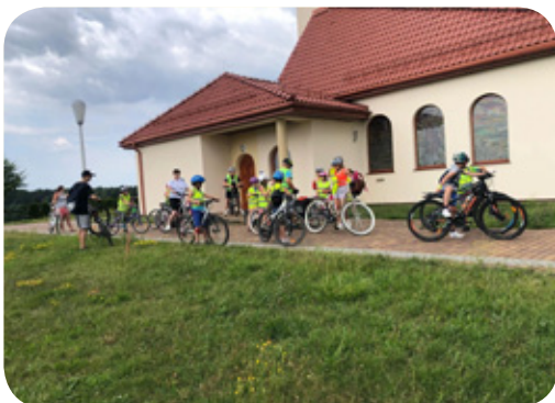
Wycieczka rowerowa zorganizowana przez Stowarzyszenie na rzecz rozwoju sołectwa Dyrdy-Sośnica