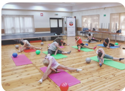
Just Go Fitness - Gminny Ośrodek Kultury w Herbach