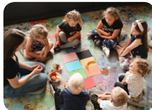
Zajęcia językowe, plastyczne i matematyczne zorganizowała Świetlica Edukacyjna Jaworek