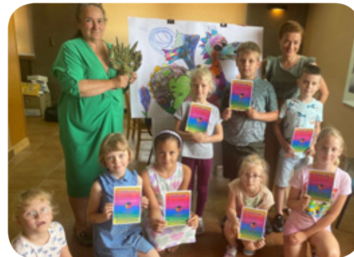
Warsztaty rozwijające kompetencje społeczno-emocjonalne zorganizowane przez Publiczną Poradnię Psychologiczno-Pedagogiczną w Lublińcu