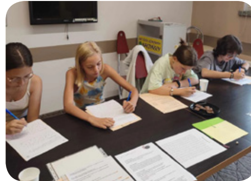
Warsztaty z technik pamięciowych i koncentracji uwagi zorganizowane przez Golden Minds