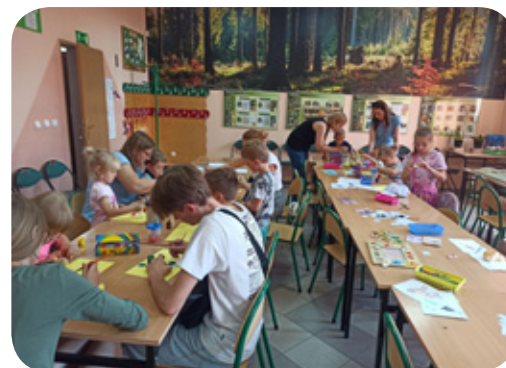
Zajęcia przyrodnicze dla dzieci zorganizował Ośrodek Edukacyjny Zespołu Parków Krajobrazowych Województwa Śląskiego w Kalinie