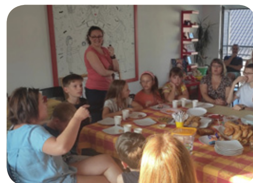
Szkoła Artystyczno-Językowa Kmeleon przygotowała spotkania z zabawami w języku angielskim i hiszpańskim