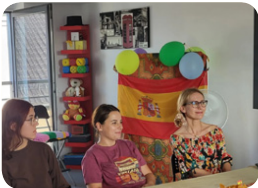
Szkoła Artystyczno-Językowa Kmeleon przygotowała spotkania z grami i zabawami w języku angielskim i hiszpańskim