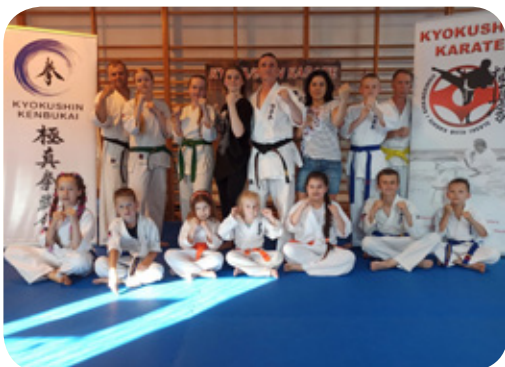
Zajęcia z podstawowymi technikami karate zorganizował Śląski Klub Karate i Kick-Boxingu