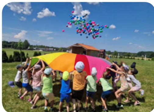
Zajęcia dla dzieci zorganizowane przez Stowarzyszenie na rzecz rozwoju sołectwa Dyrdy - Sośnica