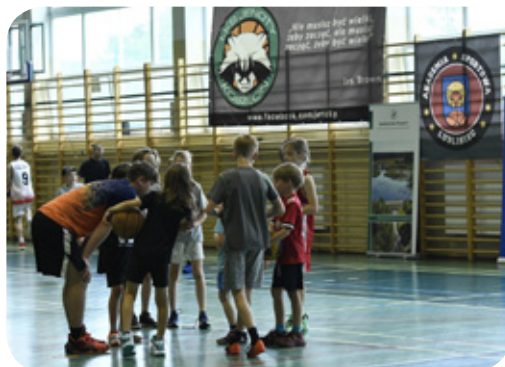
Akademia Sportowa Lubliniec