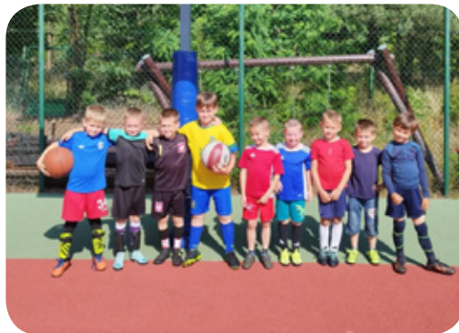
Turniej dla dzieci zorganizowany przez TKKF Boronovia