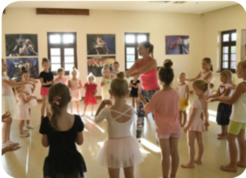
Warsztaty taneczne zorganizowane przez Zespół Pieśni i Tańca Śląsk