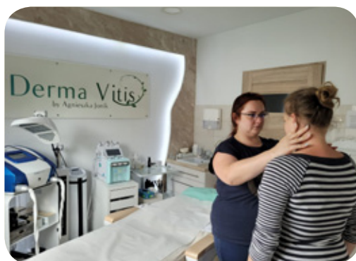
Konsultacje z fizjoterapeutą zorganizowane przez Derma Vitis