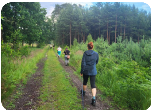
Zajęcia Nording Walking zorganizowane przez Sanus Vivere