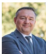
Starosta Joachim Smyła