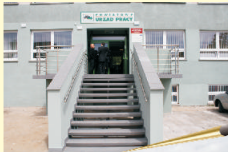
Powiatowy Urząd Pracy mieści się teraz w wyremontowanej części dawnego Ośrodka Zdrowia