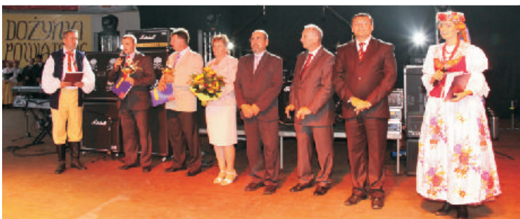
Laureaci konkursu „Na najlepszy zakład przetwórstwa rolno-spożywczego oraz najlepsze gospodarstwo rolne Powiatu Lublinieckiego”.