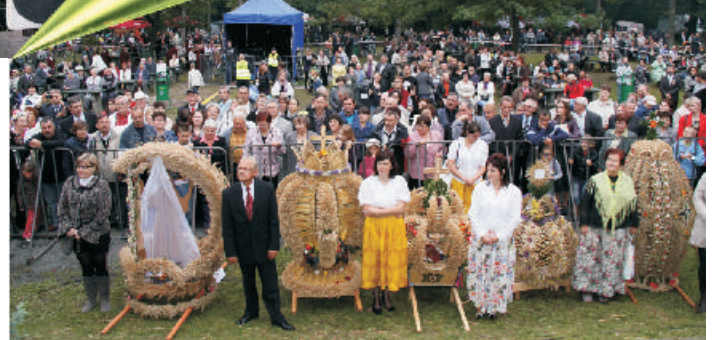
Konkurs na najładniejszy wieńiec dożynkowy wygrała gmina Pawonków