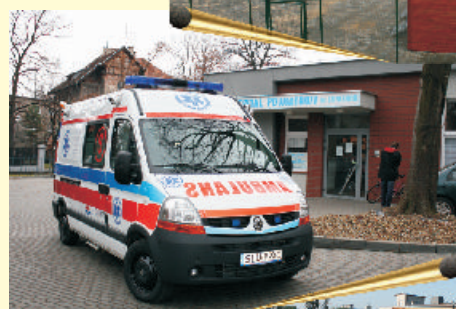
Karetka pogotowia wyposażona w najwyższej jakości sprzęt ratujący życie, w tle oddany w 2007 r. budynek Szpitalnego Oddziału Ratunkowego