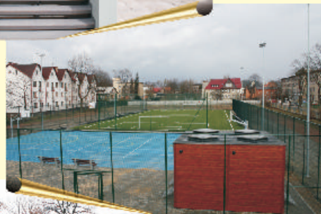
Boisko przy Zespole Szkół nr 1 im. A. Mickiewicza powstałe w ramach programu "Orlik 2012"