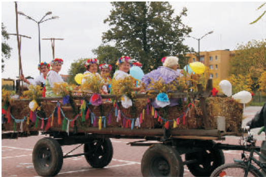
Barwny korowód wyruszył z targowiska do amfiteatru