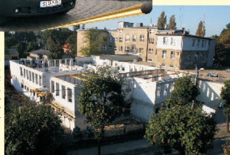
W dobudowywanym skrzydle szpitala znajduje się oddział pediatryczny, ginekologiczno-położniczy i porodowy