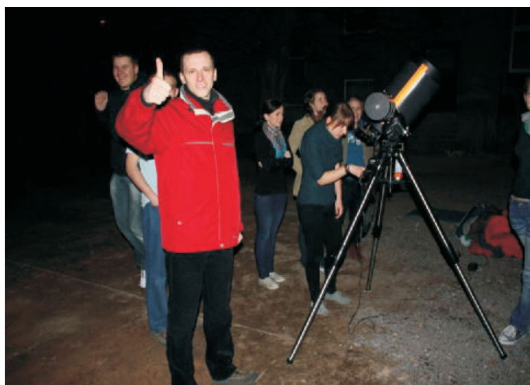
Zajęcia edukacyjne z fizyki - koło astronomiczne