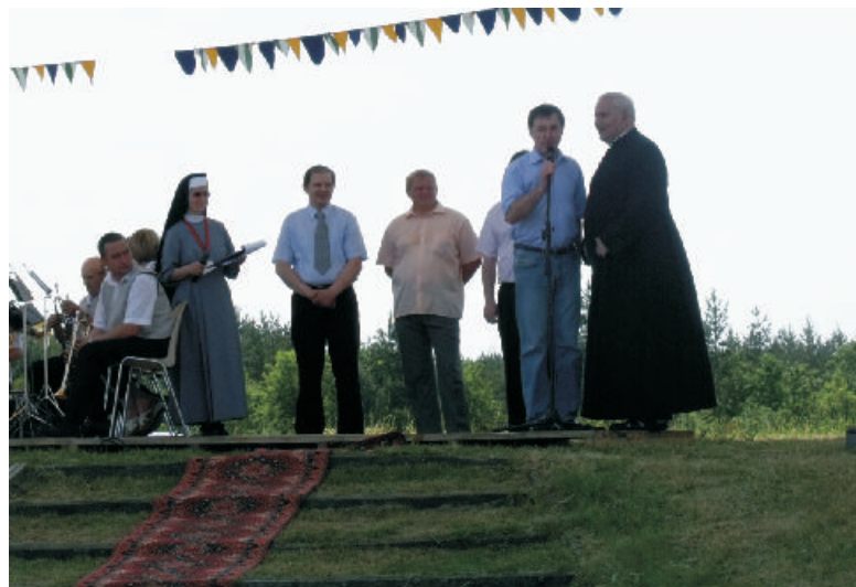
Oficjalne otwarcie Olimpiady

Sportowej rywalizacji towarzyszyła radość, uśmiech i wzajemna przyjaźń. Wszyscy uczestnicy zajęli pierwsze miejsca i każdy z nich otrzymał medal, pamiątkowy dyplom i upominek. Spartakiadę zakończył barwny występ formacji tanecznych z Miasteczka Śląskiego.