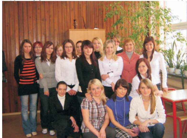
Uczestnicy projektu "Prus, Mickiewicz, Słowacki - będzie takich więcej"