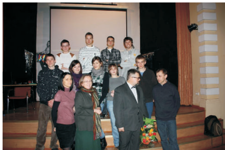
Uczestnicy projektu "Wspólnie w stronę nauki"

ności formułowania tezy, argumentów oraz wniosków dotyczących określonego tematu. Dzięki uczestnictwu w projekcie uczniowie nabyli umiejętności przemawiania, poprawnej artykulacji, dyskusowania, argumentowania oraz skutecznego łączenia przekazu werbalnego z niewerbalnym. Zajęcia edukacyjne z dziennikarstwa pozwoliły rozwinąć umiejętności krytycznego odbioru mediów, odróżniania opinii od informacji, rozpoznawania i stosowania perswazji i manipulacji.