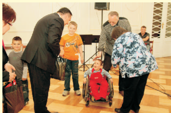
Co roku Starostwo Powiatowe organizuje Dzień Rodzicielstwa Zastępczego