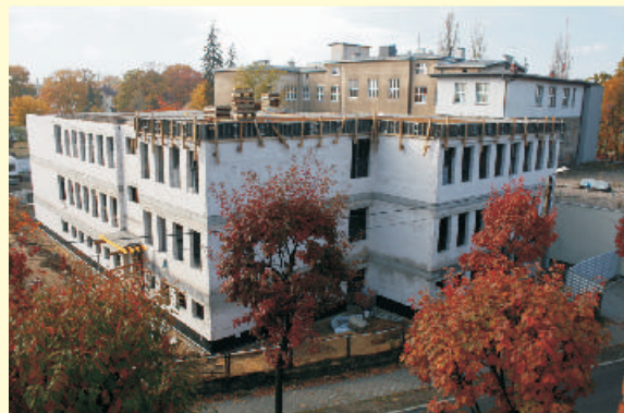
Obiekt szpitalny w budowie