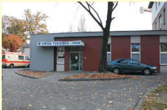
Szpitalny Oddział Ratunkowy