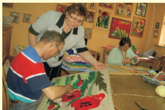
Zajęcia uczestników Warsztatów Terapii Zajęciowej