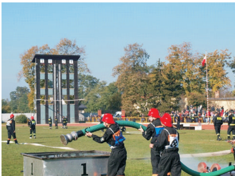
Kobieca drużyna z OSP Kośmidry w czasie wykonywania ćwiczenia bojowego