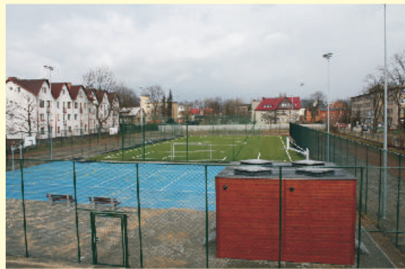
Boisko przy Zespole Szkół nr 1 im. A. Mickiewicza w Lublińcu zbudowane w ramach programu ORLIK 2012