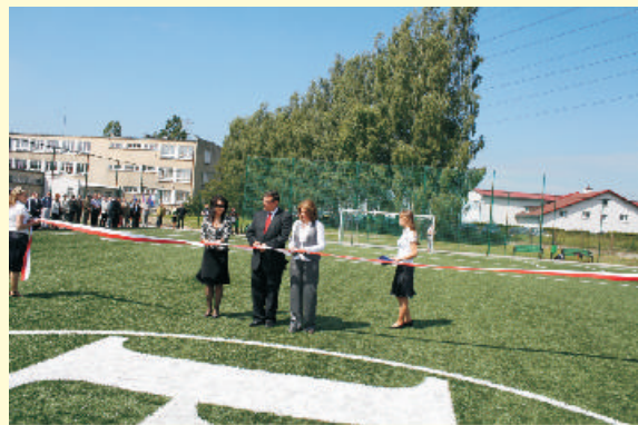
Otwarcie boiska z programu "Blisko boisko" przy Zespole Szkół Zawodowych w Lublińcu