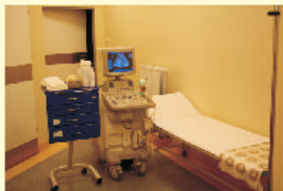
Pracownia USG z aparatem Logiq 3 Pro