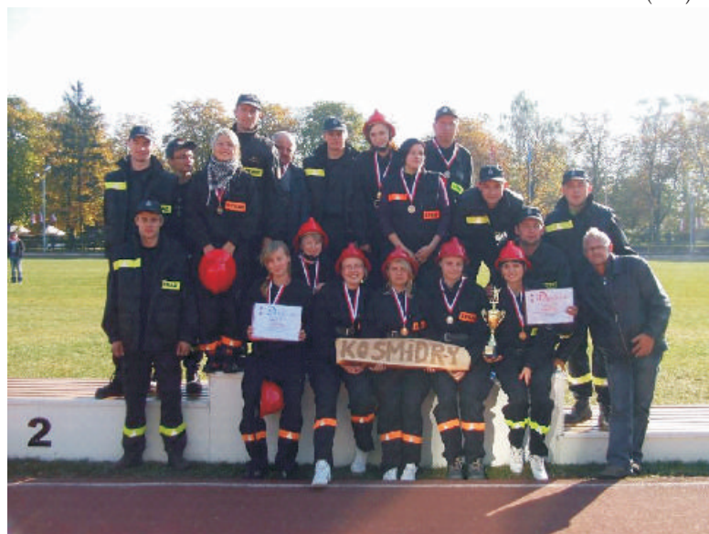
Drużyny z OSP Kośmidry i OSP Solarnia